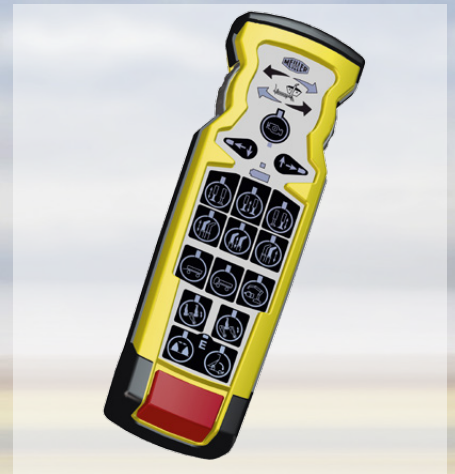
Funkfernsteuerung i.s.a.r.-control mit Folgesteuerung