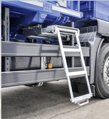
Seitlicher Aufstieg BG-konform