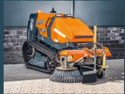
M201 mit Wildkrautbürste

Weitere Anbaugeräte: Kehrbesen, Stubbenfräse, Schneefräse, Doppelmesserbalken und viele mehr.