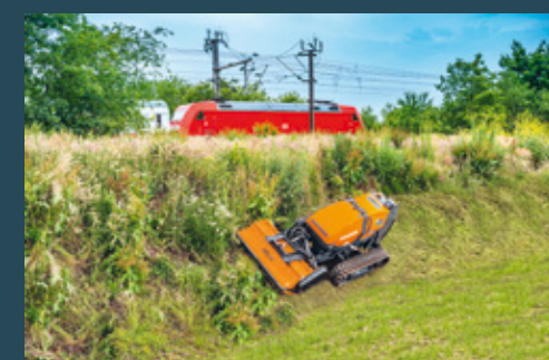
Alle verbauten Komponenten sind für Arbeiten an Steillagen mit bis zu 55° geprüft und zugelassen.