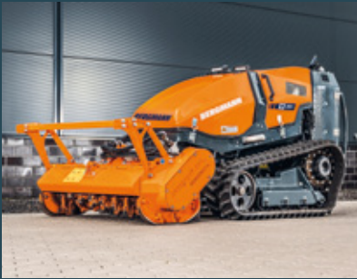
M201 mit Forstmulcher

Unsere Funkraupe kann in den unterschiedlichsten Bereichen der kommunalen Landschaftspflege und bei Forstarbeiten eingesetzt werden. Möglich ist dies dank der verschiedenen Anbaugeräte, die externe Premiumhersteller speziell für die Bergmann M201 entwickeln. Der Clou: Die Funkraupe kann somit das ganze Jahr über ausgelastet werden.