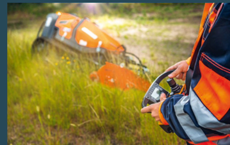
Beidseitig ausfahrbares Raupenfahrwerk mit Bergmann Anti Drift Control für mehr Stabilität.

Die Belegung und Feinfühligkeit der Funkanlage lassen sich kundenspezifisch anpassen. Der 4-Wege-Joystick ermöglicht die einhändige Fahrt, während die zweite Hand Raupenfunktionen wie u. a. die Anti Drift Control, Spiegelschaltung, Fahrwerkbreite sowie den Einsatz des Anbaugeräts und hydraulischer Zusatzgeräte steuert.