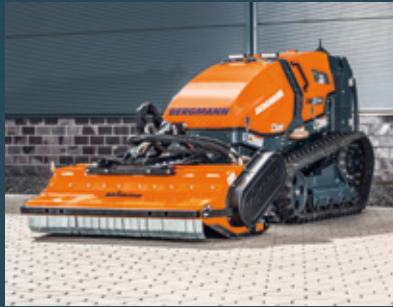
M201 mit Schlegelmulcher