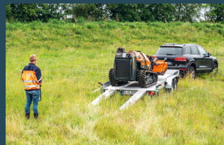
Einfacher und schneller Transport mit der Führerscheinklasse BE.